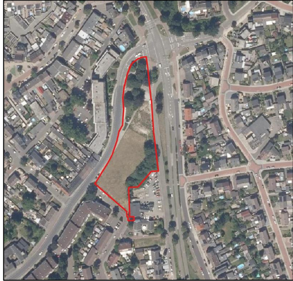
Globale begrenzing plangebied