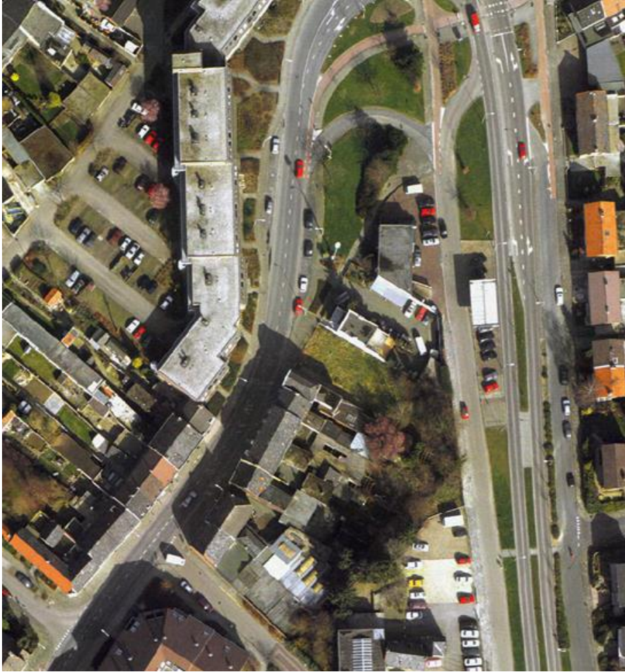
Situatie in 1999