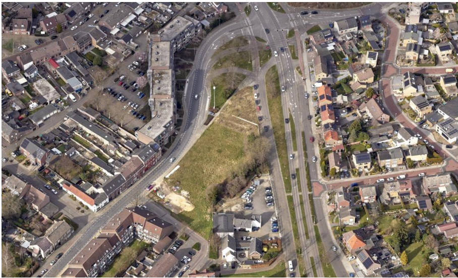
Situatie in 2022